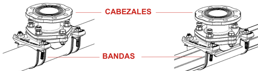
Montado sobre tubo de fundición